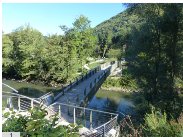
1. et 2. La passerelle 3. Les sanitaires 4. Plantations

La passerelle a été préfabriquée à Colomiers, en atelier, puis transportée par convoi exceptionnel en porte-char et enfin montée sur site à l'aide d'une grue de très grand gabarit (800 tonnes), pour contrebalancer la portée au dessus de l'Ariège. Elle mesure 2,50 m de large, facilitant un croisement sans gêne du public et 66 m environ de longueur (alors qu'à cet endroit l'Ariège ne mesure que 36 mètres), de manière à prendre en compte en douceur, avec une pente toujours inférieure à 4%, un indispensable passage hydraulique (en cas de crues exceptionnelles).